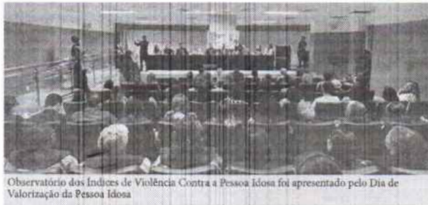
Observatório dos Índices de Violência Contra a Pessoa Idosa foi apresentado pelo Dia de Valorização da Pessoa Idosa

A Defensoria Pública do Estado do Maranhão (DPE/MA) e a Rede Nacional de Proteção e Defesa da Pessoa Idosa no Maranhão (Renadi/MA) lançaram, nessa quinta-feira (5), o Observatório dos Índices de Violência Contra a Pessoa Idosa no Maranhão. O canal virtual de observação e monitoramento foi apresentado à sociedade durante evento alusivo ao Dia de Valorização da Pessoa Idosa, promovido pela Escola Superior e o Centro Integrado de Apoio e Prevenção à Violência contra a Pessoa Idosa (Ciapvi).